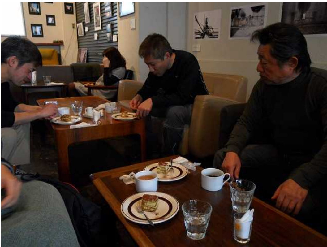
ビーフストロガノフ・ライス・サラダのワンプレートランチで、食後はスイーツ+ドリンクがセットで¥1,500 でした。