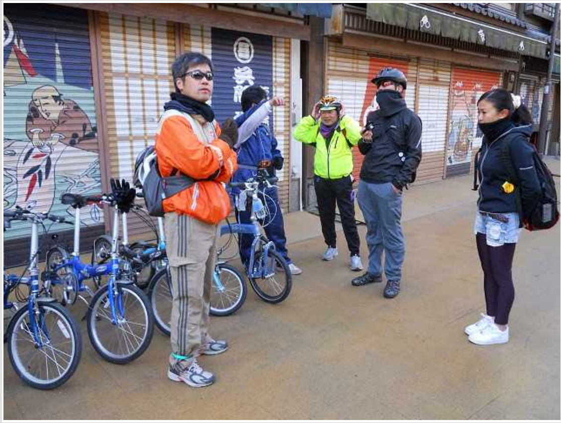
それから本堂に向かい、途中で受香をしたりお賽銭を入れてお参りをしました。