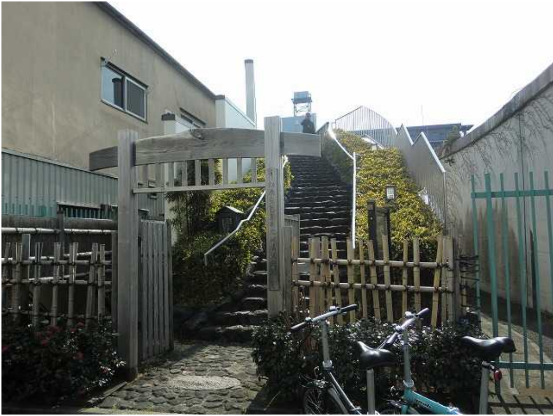
自転車を置いて 20 段程の階段を登ると松尾芭蕉の銅像がありました。